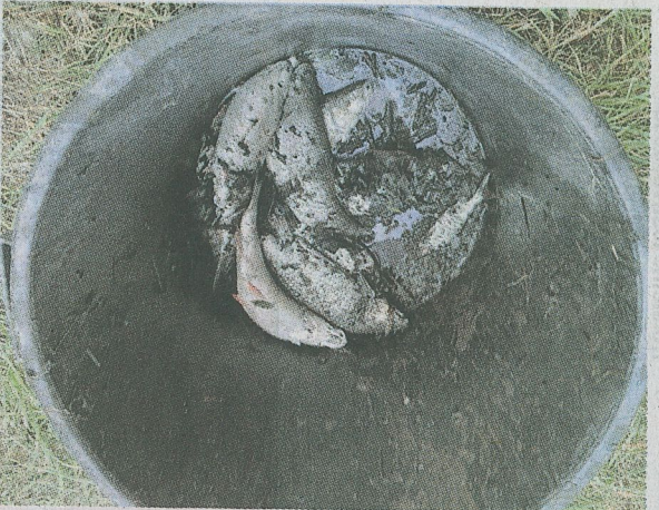
En période de sécheresse, les poissons payent un lourd tribut.

Du recul, cet agent et pêcheur d'expérience en a suffisamment pour tirer le sonnette d'alarme. Déjà une dizaine d'années qu'il parcourt les rivières de quelque 66 communes pour en suivre l'étiage, « cette période où les cours d'eau sont à leur plus bas niveau, avec un débit très faible ». Son constat est sans appel : la situation ne cesse de se dégrader, vite, bien trop vite pour que la