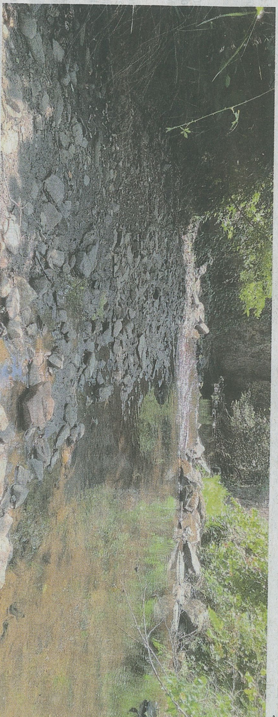
Trois mois, à peine, séparent ces deux photos de la Madrange. En mai 2025 (photo du dessus), le débit du ruisseau s'établissait à 337 L/s, contre 44 L/s à la mi-août (photo du dessous).

faune aquatique ne puisse s'y adapter. Là où, dans un proche passé, « la phase d'étiage prenait fin en septembre », et ne courait donc que sur la période estivale, il faut désormais attendre octobre, novembre voire, l'entrée dans l'hiver pour que les cours d'eau retrouvent un débit acceptable. « En 2022, nous avons même failli poursuivre nos relevés jusqu'aux fêtes de Noël ! Heureusement, la pluie a fini par arriver à quelques jours du Réveillon » se rappelle-t-il.