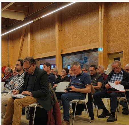
Elus de la mandature 2020-2026 au SIAV

La GEMAPI est la principale compétence du SIAV. Elle est la conséquence de l'application de la réglementation européenne Directive Cadre sur l'Eau et est obligatoire depuis 2018 pour les Etablissements Publics de Coopération Intercommunal (EPCI).