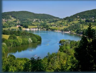
Le Causse - Lissac sur Couze