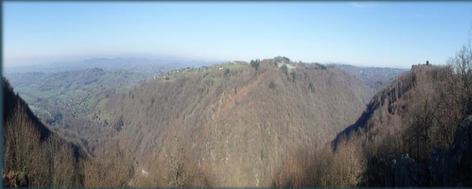
Natura 2000 – Vallée de la Vézère

Une étude a été lancée en octobre 2021 sur les compétences « Sentiers d'intérêt non-communautaires », « Sauvegarde du patrimoine vernaculaire public », « Natura 2000 » et « Opérations aménagements » afin d'établir un inventaire à partir d'un diagnostic visuel et de réviser chaque compétence pour les dynamiser selon le potentiel de chacune.