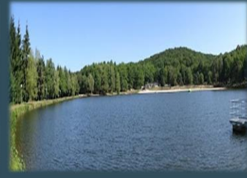
Les Forges - Masseret Lamongerie