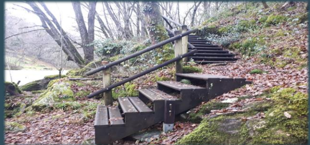
Sentiers - Escaliers le long de la Vézère (GR46) à Vigeois