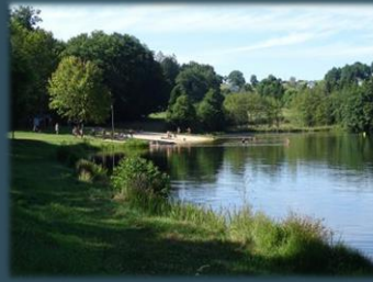
Fontalavie - Chamboulive