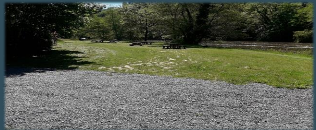
Opérations aménagements – Halte nautique à Estivaux