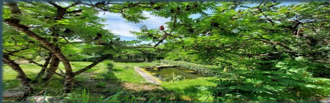
Sauvegarde du Patrimoine - Lavoie du Mas à Lissac-sur-Couze