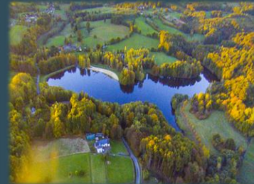
Pontcharal - Vigeois