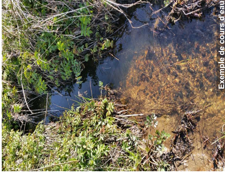
Exemple de cours d'eau

Les opérations 1, 2 et 3 du schéma ci-contre ne nécessitent aucune formalité administrative préalable.