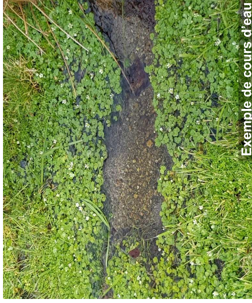
Exemple de cours d'eau

L'écoulement peut ne pas être permanent compte tenu des conditions hydrologiques et géologiques locales.