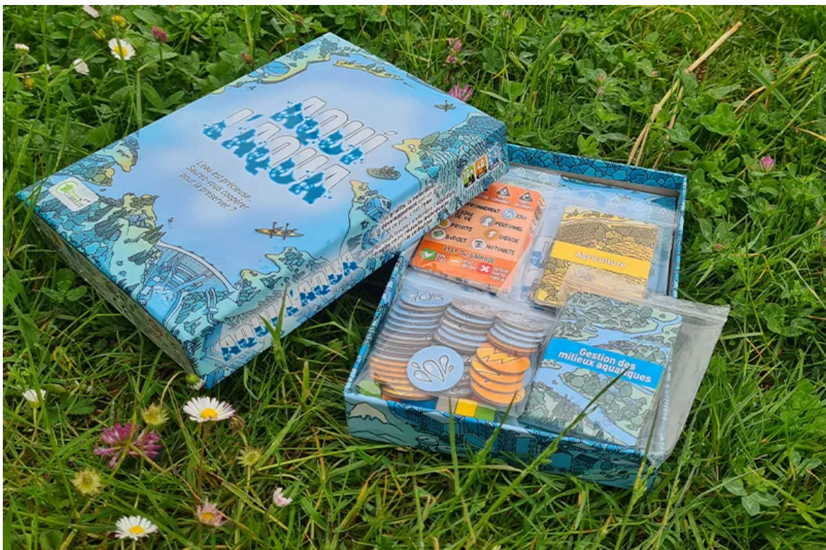
Le jeu « Aquil'Aqua » permet de sensibiliser les plus jeunes aux enjeux et problématiques autour des cours d'eau

Le syndicat a également développé plusieurs outils pédagogiques : des jeux en bois, une fresque de l'eau ou encore un jeu baptisé « Aquil'Aqua » pour mieux comprendre les enjeux autour des rivières. À travers ces animations, le SIAV cherche surtout à rendre visibles des problématiques souvent méconnues : la continuité écologique des rivières, la circulation des poissons, l'importance des zones humides ou les conséquences des sécheresses répétées.