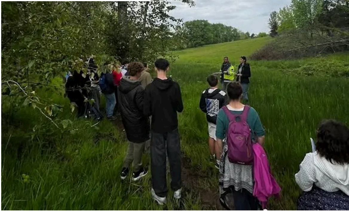
Visite de la zone humide du Vignal pour les éco-délégués du collège d'Allasac

Dernière initiative en date : un escape game conçu avec la fédération de pêche à destination des accueils de loisirs pour cet été. Le principe ? Une truite va devoir retrouver sa frayère dans une rivière dégradée. Un angle ludique qui permet d'aborder les conséquences des activités humaines sur les cours d'eau. « Nous avons choisi la truite parce que c'est une espèce patrimoniale et qu'elle est très sensible à la température de l'eau », explique Coraline Breil. Au-delà de 20 °C, la truite cesse même de s'alimenter.