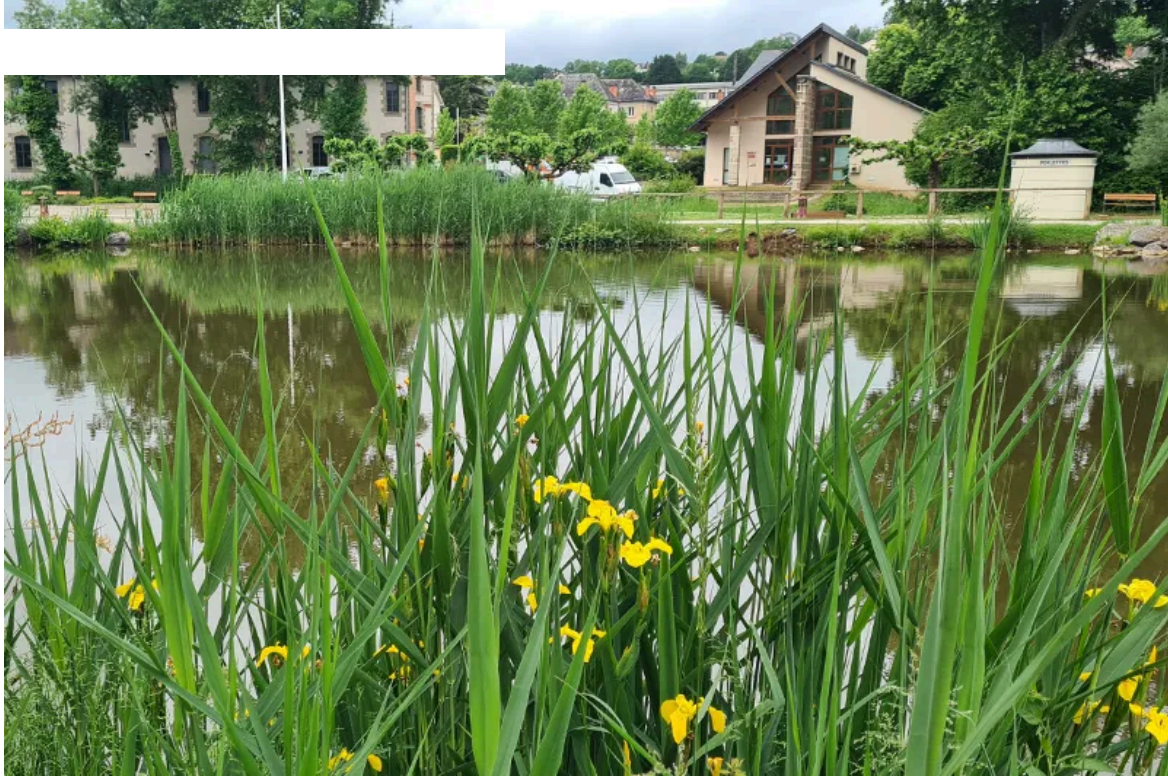
Encore en projet, une « Maison de l'eau et la biodiversité » pourrait voir le jour prochainement à Objat

Mais aujourd'hui, le SIAV cherche aussi à rendre ces sujets accessibles au grand public.