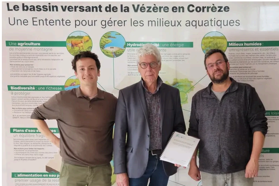
Au mois de mai, le SIAV a déposé un programme pluriannuel de gestion coordonnée qui s'étend sur les territoires de 7 EPCI !

passage des poissons et des sédiments. Le syndicat est aussi « le porte-parole des milieux aquatiques », des actions locales, relatives notamment à l'aménagement du territoire. Il a par exemple déposé un programme de gestion coordonnée qui est devenu la feuille de route sur les dix prochaines années ; un travail discret mais essentiel pour préserver l'équilibre des cours d'eau.