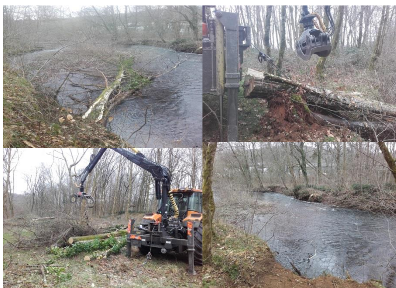
Figure 1: Photos évacuation de Charme sur la Corrèze

Dans le cadre du programme annuel d'entretien des berges de la Corrèze, le SIAV est intervenu en début de mois pour procéder à l'évacuation d'arbres tombés dans le lit de la Corrèze en amont de Malemort-sur-Corrèze et sur la Roanne commune de Dampniat, afin de prévenir tout dommage aux ouvrages (ponts) en cas de crue.