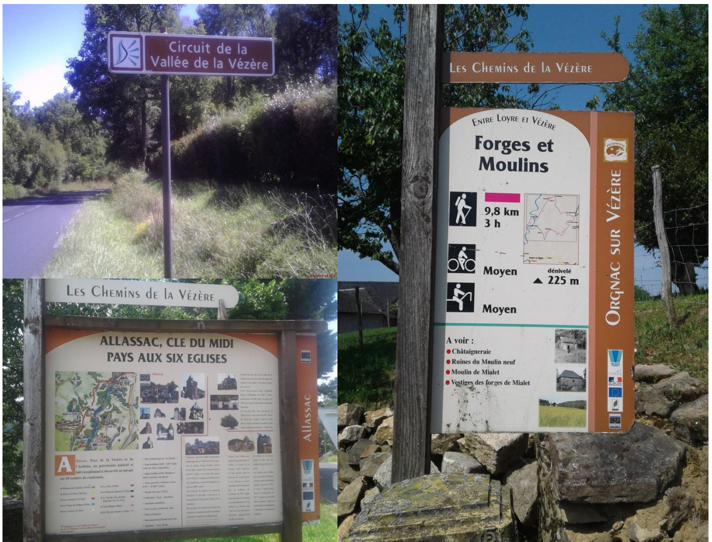
Figure 3 : Exemple de panneaux signalétiques de la vallée de la Vézère

De même il a été réalisé un inventaire géo référencé des panneaux de signalisation (RIS, départ sentiers et Itinéraire Découverte) pour la clôture de la carte promotion Touristique.