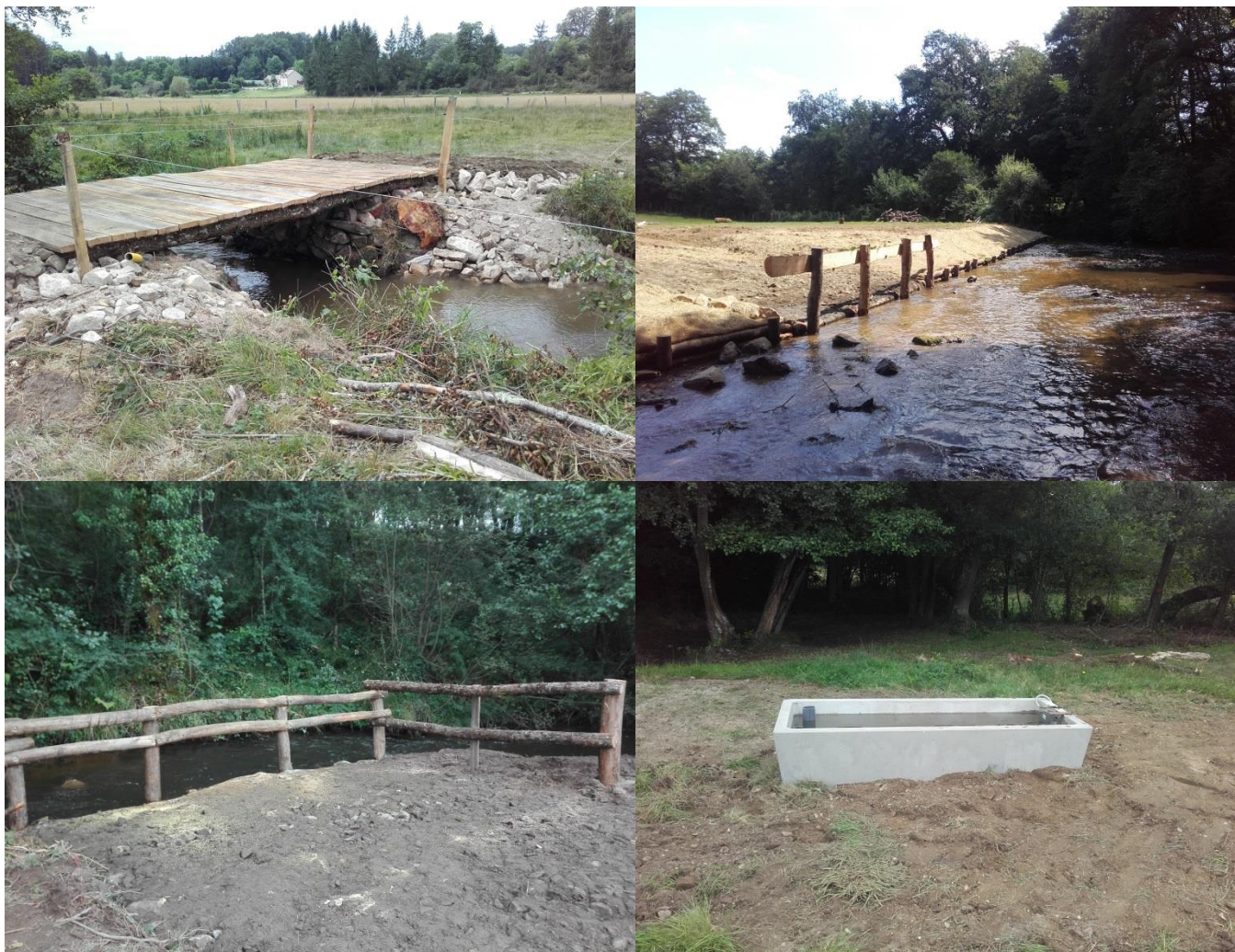
Figure 4 : Exemples d'aménagements MEDA réalisés en 2017

Les agents du SIAV ont réalisé durant l'été, le reliquat des travaux MEDA 2016 chez 5 exploitants.