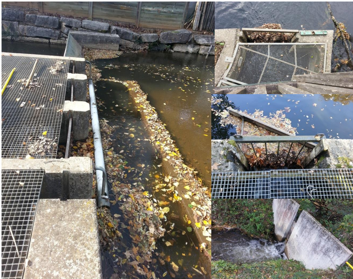
Figure 2 : Amont des passes à poissons suivis par le SIAV

Ces interventions sont régulières, fréquence 1 fois tous les quinze jours (sur 10 mois) et nécessite par intervention ½ journée. Soit pour l'année 2017, une semaine d'activité.